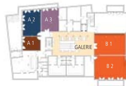
UNTERGESCHOSS Ateliers | Galerie